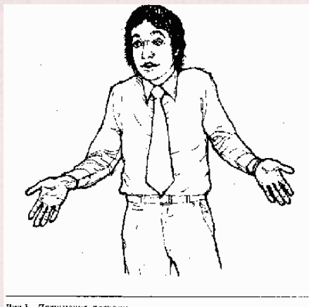
Рис.1. Пожимание плечами.

Открытые во время беседы ладони поощряют собеседников быть взаимно откровенными и доверчивыми